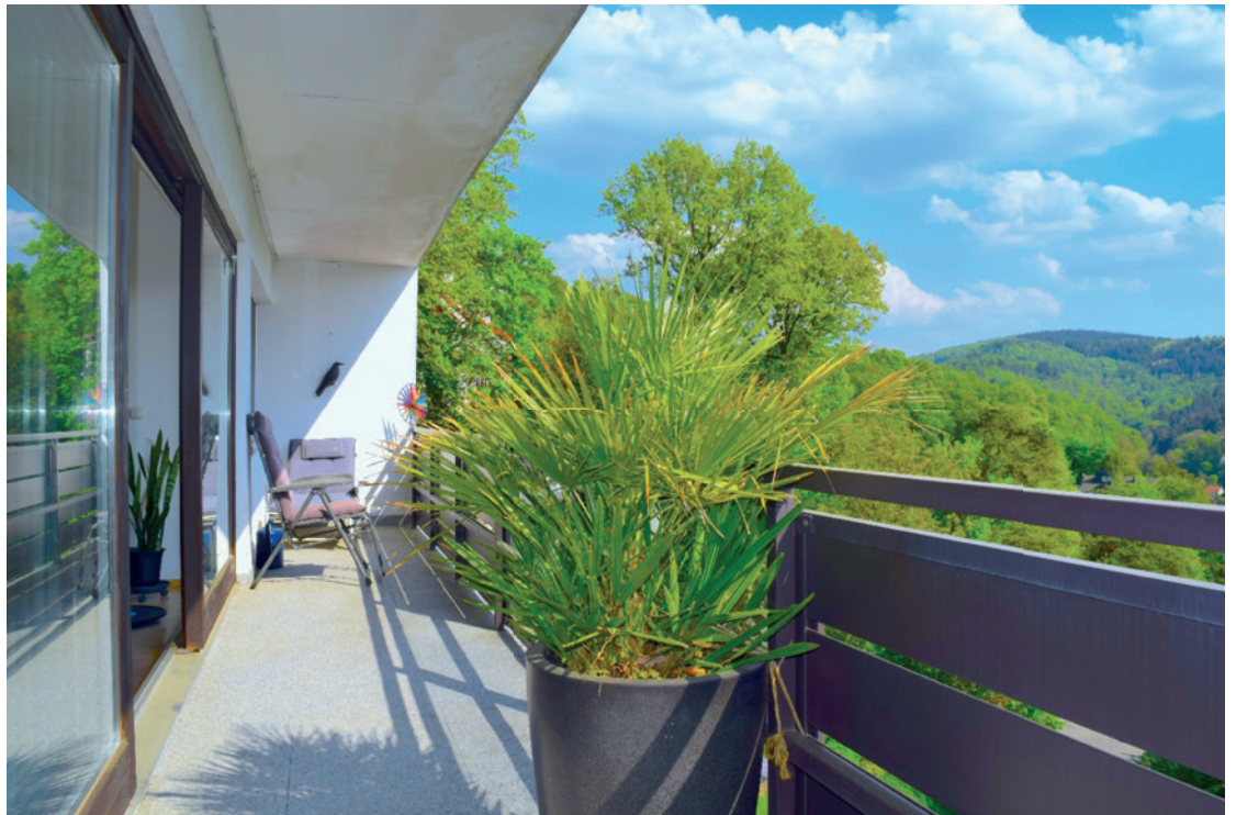
Sonniger Raumkomfort und Wohnvergnügen mit traumhaftem Ausblick, Natur und Ruhe